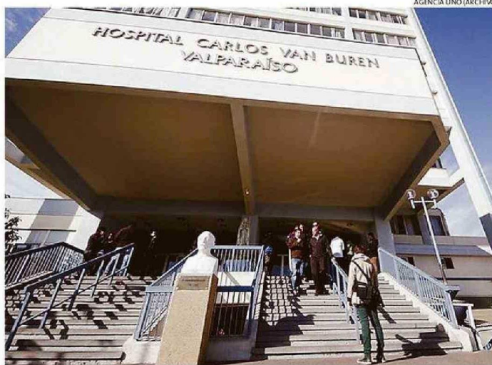
PESE A QUE SE DIJO QUE LOS 4 PABELLONES CERRADOS PREVIAMENTE SE ABRIRÍAN, NO HA OCURRIDO.

Quien sí abordó esta preocupante problemática que impactará directamente en la resolución de la lista de espera quirúrgica, fue Sagredo.