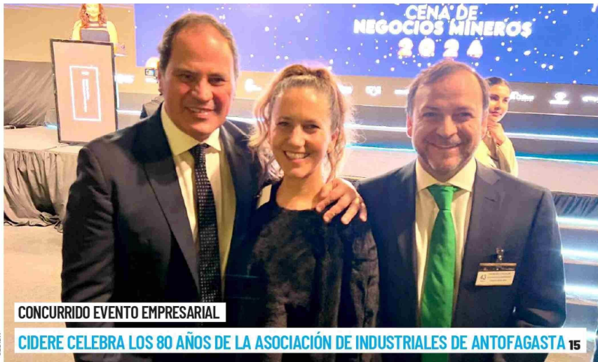
CONCURRIDO EVENTO EMPRESARIAL

En lo que será el tercer reajuste del año de las tarifas eléctricas, previsto para el mes de octubre, la comuna-puerto aparece como la segunda ciudad a nivel nacional, con el mayor incremento, sólo por detrás de Copiapó. Parlamentarios, en tanto, piden extender subsidios. 2