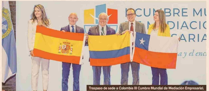
Traspaso de sede a Colombia III Cumbre Mundial de Mediación Empresarial.