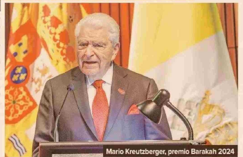
Mario Kreutzberger, premio Barakah 2024