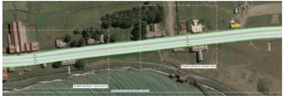
Las imágenes muestran la zona típica conformada por la estancia San Gregorio y edificios aledaños (izquierda) y la doble vía propuesta (derecha).