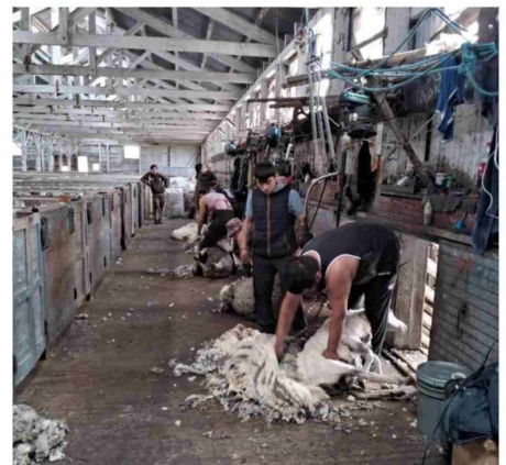
El abogado afirmó que, contrario a lo sostenido por la empresa, sí hay actividad en el recinto.

Asegura que el problema de la falta de inversiones en Chile, "no es la permisología... se olvidan de la carga tributaria, rigidez laboral, falta de seguridad, la corrupción y la mala calidad del Gobierno, Parlamento y Poder Judicial".