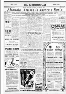
Portada del 22 de junio de 1941, que aborda la invasión nazi a la URSS.

nista lo respaldó por completo, considerándolo un acto en favor de la paz y una muestra de la vocación pacifista de la Unión Soviética. Así, el PC chileno terminó apoyando el pacto de manera total", señala Fernandois. Un año después, a consecuencia del pacto, termina la unidad del Frente Popular en Chile.