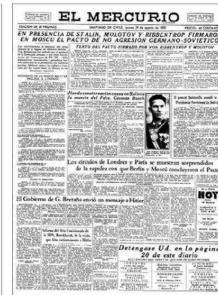
"El Mercurio" del 24 de agosto de 1939 informó del pacto.

"Para los socialistas, este pacto fue objeto de fuertes críticas porque el Partido Comu-