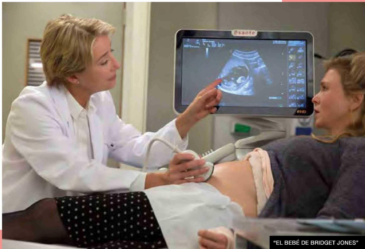
“EL BEBÉ DE BRIDGET JONES”

SIN DUDA, GRAN PARTE DEL ÉXITO DE “EL DIARIO DE BRIDGET JONES” FUE PORQUE SU HEROÍNA SE TRANSFORMÓ EN UN CLARO ESPEJO PARA UNA GENERACIÓN DE MUJERES que ya superaba los 30 años y se encontraba en una escena profesional y de soltería en la que no se hacía fácil encontrar prospectos románticos con proyección. Esa misma audiencia que la conoció en el debut del libro de Helen Fielding (luego hecho película con Renée Zellweger) se reencontró con el personaje una década después en otra etapa que las reflejaba: un primer embarazo sobre los 40 años. En la tercera cinta, la protagonista va donde su ginecologista (en la pantalla, Emma Thompson) en busca de algún tipo de orientación, la especialista le dice que a sus 43 años ya es “una madre geriátrica”. Un momento que sacó carcajadas en las salas de cine, pero que ya definía una realidad internacional que no era mera fantasía de un guión.