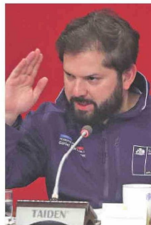
El Presidente habló desde EE.UU. por el caso.

Hoy, Marcela Cubillos postó que “Parlamentarios de izquierda quieren convertir en delito el sueldo de sus adversarios y terminar con la libertad de educación y de trabajo. El octubrismo igual de