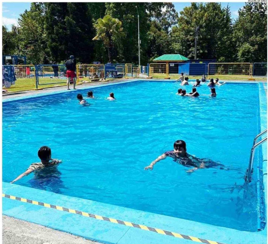
LAS PISCINAS DEL CAMPING OLEGARIO MOHR HAN TENIDO ALTA DEMANDA DE DELEGACIONES Y PASEOS DE CURSO.

“En todo caso, no será mucho el incremento, más que nada para cerrar los montos, en realidad más por el tema del sencillo al pagar”, aseguró.