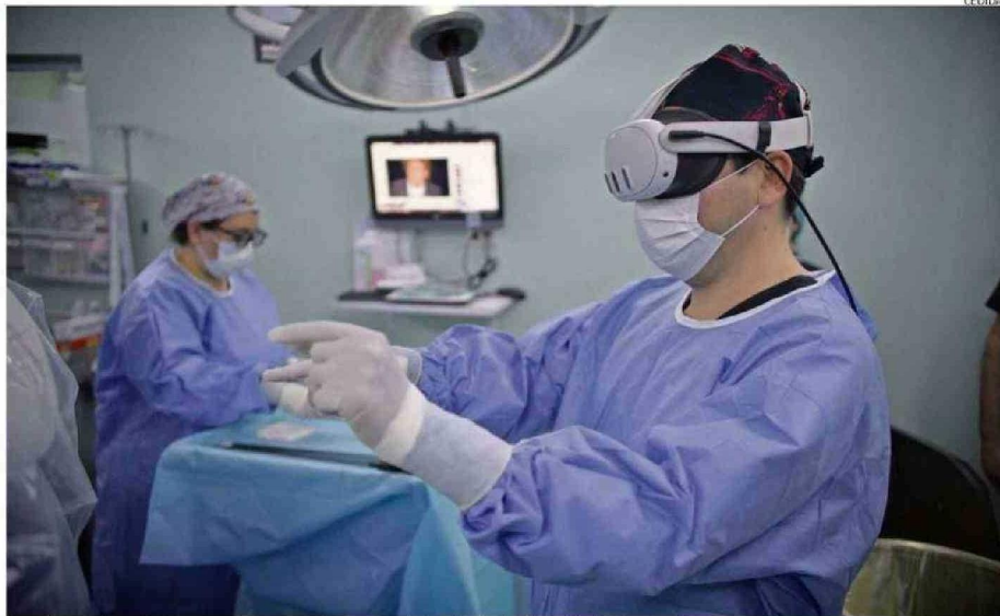
Los visores de realidad aumentada proyectan una pantalla virtual de alta definición frente al cirujano.

Esta innovadora plataforma, aprobada por la Administración de Alimentos y Medicamentos de Estados Unidos (FDA, por sus siglas en inglés), utiliza la tecnología que permite a los facultativos