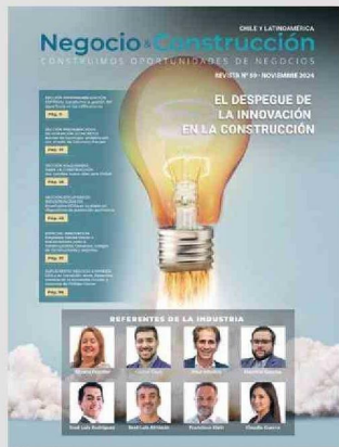
Edición 59 - noviembre 2024