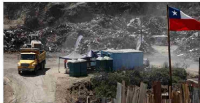
Delegación Presidencial de Valparaíso adeuda $6 mil millones a empresa que realizó trabajos de limpieza durante el megaincendio