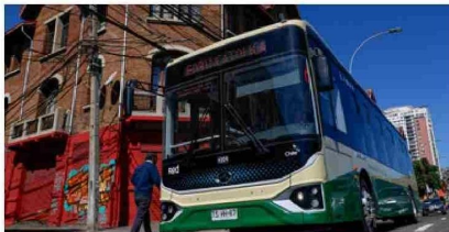
Dan inicio a la licitación del sistema de transporte público mayor del Gran Valparaíso: primera etapa contempla 240 buses eléctricos