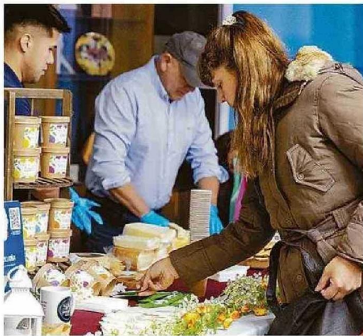
PRODUCTORES AGRÍCOLAS, APÍCOLAS, CHOCOLATEROS, ARTESANOS Y MUCHOS MÁS SE REUNIRÁN EN VALPARAÍSO.

ción cuenta con la colaboración del Gobierno Regional, municipios de Valparaíso, Concón, Santa Domingo, además de Indap, Sernatur, ProChile, Sercotec y Ministerio de las Culturas entre otros.