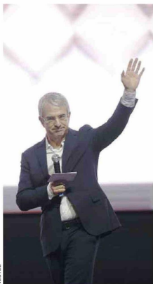
Laurent Freixe, CEO de Nestlé, encabezó el IX Encuentro por los Jóvenes de la Alianza del Pacífico, quien destacó la relevancia de poner a los jóvenes en el centro de las acciones, abordando los desafíos en torno a la empleabilidad y oportunidades laborales.

En el marco de la actividad, Nestlé anunció el fortalecimiento en la incorporación de jóvenes en los procesos de innovación de la compañía, tras la realización del primer Bootcamp de Innovación en Alimentos.