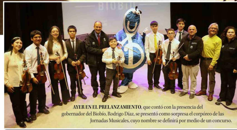
AYER EN EL PRELANZAMIENTO, que contó con la presencia del gobernador del Biobío, Rodrigo Díaz, se presentó como sorpresa el corpóreo de las Jornadas Musicales, cuyo nombre se definirá por medio de un concurso.

El programa ejecutado por Artistas del Acero con el apoyo del Gobierno Regional del Biobío, del 27 al 30 de junio vivirá diversas actividades formativas -que concluirán con dos conciertos- en el Colegio Concepción de Pedro de Valdivia reuniendo a más de 500 niños, niñas y jóvenes pertenecientes a diversas orquestas de la Región.