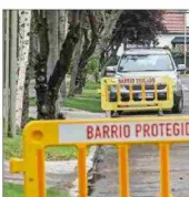
Las medidas de seguridad deben involucrar un esfuerzo mancomunado entre diversas instituciones, plantean especialistas.

Añade que "luego la estrategia debe considerar incentivos económicos para las familias y municipios para la reinserción escolar de jóvenes desahuciados, instalación de 'oficinas de oportunidades laborales' de cooperación público-privada para dar trabajos lícitos a jóvenes y adultos".