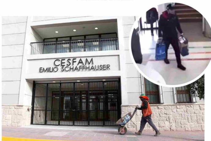
En el CESFAM Emilio Schaffhauser afirman que el médico prestó servicios en el recinto solo en una ocasión, otorgando una mala atención a usuarios y maltratos a funcionarios.