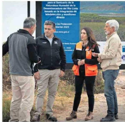
LAS AUTORIDADES ESTUVIERON EN EL LUGAR.

“La reunión que hemos tenido hoy día es justamente porque este proyecto está siendo ejecutado por tres entidades, el municipio de Arica, la Universidad de Tarapacá y las organizaciones no gubernamentales, quienes estamos empeñados en realizar en este santuario de naturaleza un plan de ma-