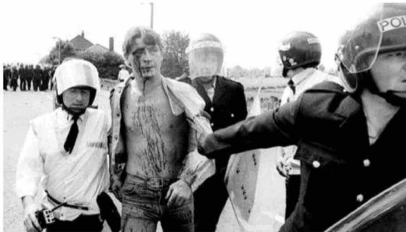
La "Batalla de Orgreave" en Sheffield, Gran Bretaña, durante la huelga minera de 1984.

tomada por estrecha mayoría. La central obrera tenía sus activos congelados y los mineros huelguistas dependían cada vez más de contribuciones voluntarias. Hubo una, de un millón de dólares, que fue anulada: provenía del futuro líder de la Unión Soviética, Mikhail Gorbachov, a quien advirtieron que su solidaridad con los mineros huelguistas podía traerle dificultades en el futuro entendimiento con los líderes europeos. La política del "Informe Ridley" aplicada por Thatcher hizo que las centrales eléctricas que atesoraban el carbón almacenado, permanecieran abiertas durante el invierno 1984-1985.