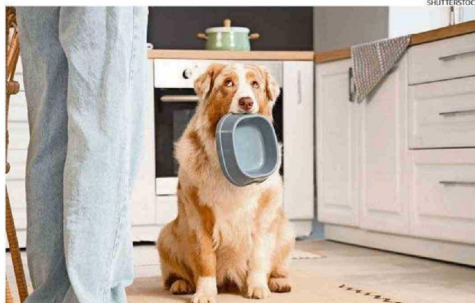
LOS PLATOS DE COMIDA ALOJAN MICROORGANISMOS Y RESIDUOS.