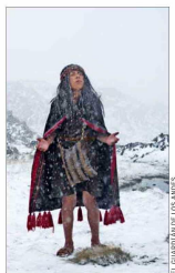
El documental recrea los meses previos a la muerte del niño.

Las recreaciones fueron realizadas en el cerro Huamán, cerca del Cuzco. Garabedín desarrolló su rodaje con la participación activa de comunidades quechuas y aimaras de dicha zona. El documental se exhibirá en dos tandas, a las 10:30 y a las 11:30 horas, en el frontis del museo. Es gratuito previa inscripción en www.mnhn.gob.cl/cartelera .