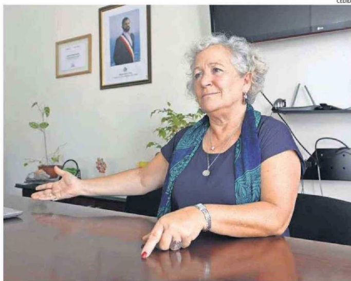
LA DIRECTORA DE SALUD CONFIRMÓ EL PRESUPUESTO BASE PARA EL HOSPITAL REGIONAL.