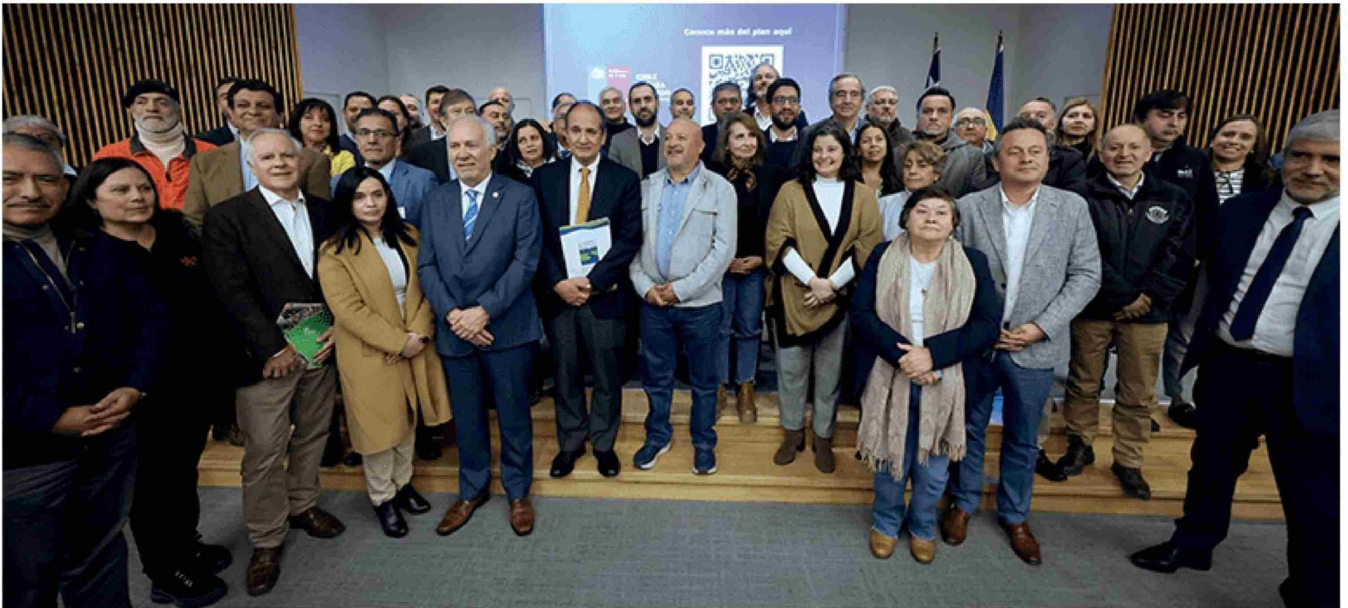
LA CEREMONIA DE PRESENTACIÓN del Plan de Fortalecimiento Industrial del Biobío se realizó recientemente en Concepción.