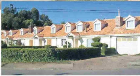
Este espacio coronelino fue un área cerrada que estaba bajo el control de la compañía carbonífera. Sus edificaciones comunitarias y el equipamiento urbano se transformaron en un aporte a la configuración de las ciudades y fueron la base para el diseño que hasta la década de 1970 entregara el Estado por todo el país, según describe el Consejo de Monumentos Nacionales.