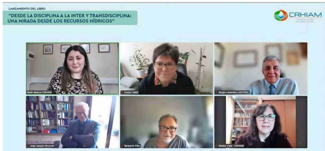
Panelistas que participaron del lanzamiento.