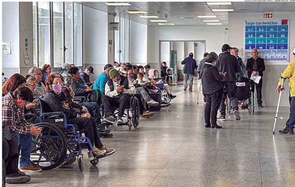
POR AHORA, EL SERVICIO DE SALUD HA PODIDO SEGUIR FUNCIONANDO SIN CANCELAR SERVICIOS.

En todo caso, el director del SSA descarta categóricamente que el servicio pueda llegar a los niveles de crisis que en otros recintos hospitalarios se ha visto como el Hospital Van