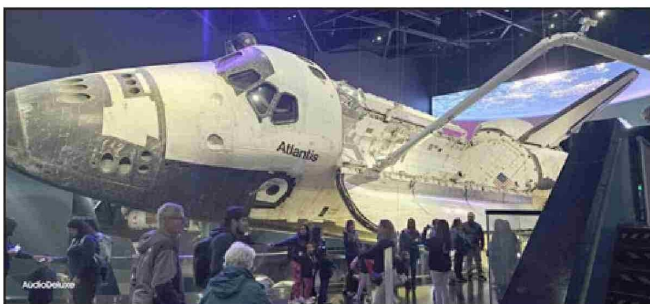
El impresionante transbordador 'Atlantis'.