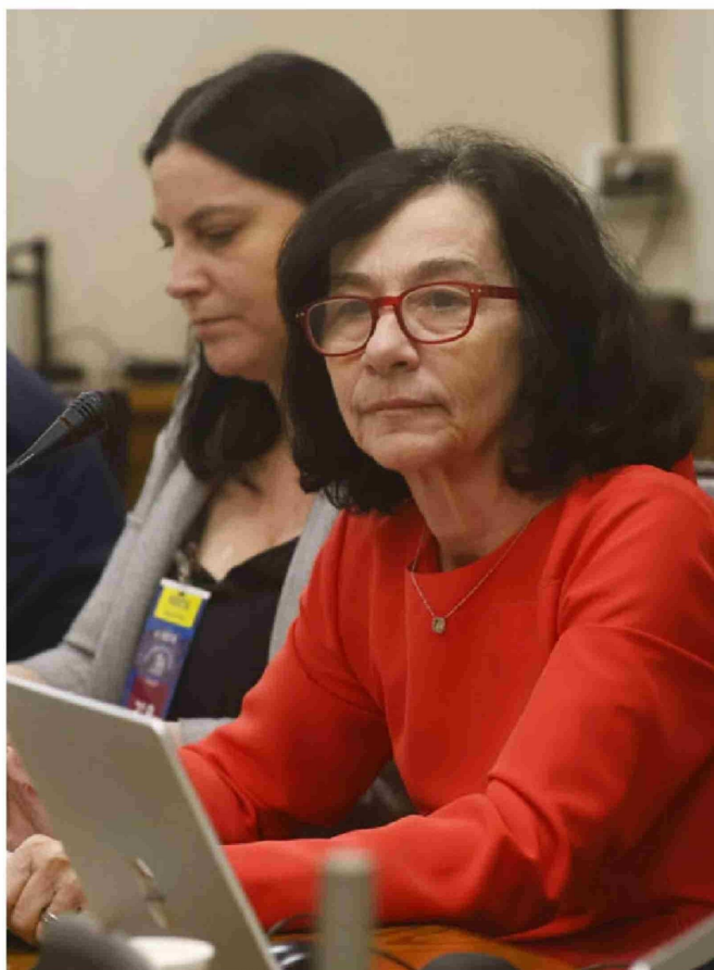
Rosanna Costa, presidenta del Banco Central, expone en Comisión de Hacienda del Senado.

En esa línea, detalló que “el mercado de capitales cumple una función crítica. Canaliza recursos entre los distintos agentes. Incide en las condiciones de financiamiento de mediano y largo plazo a la que acceden hogares y empresas, y en la capacidad de mitigar shocks externos que pueda enfrentar la economía. Por lo tanto, es una pieza clave para sustentar el desarrollo económico. La reducción de su tama-