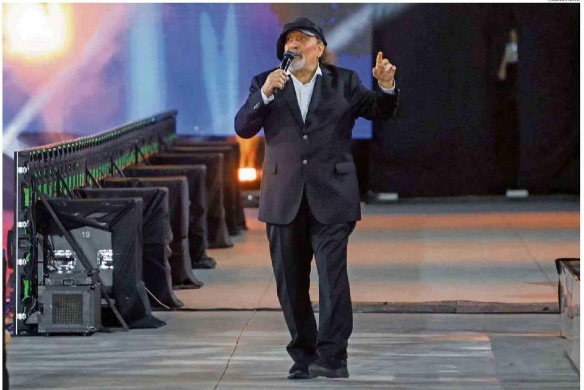
LA GALA DEL FESTIVAL DE VIÑA FUE LA ÚLTIMA APARICIÓN EN TELEVISIÓN DE MIGUEL PIÑERA LA SEMANA PASADA.

En palabras de él mismo, lo pasó "chancho" en la Unidad Popular. A pesar de no ser alguien ligado a la política (tanto de izquierda como de derecha), las peñas y el movimiento cultural fueron muy importantes para él. Esto se acabaría con el golpe de estado en 1973, con el cual disminuiría drásticamente la vida nocturna en el país, una a la