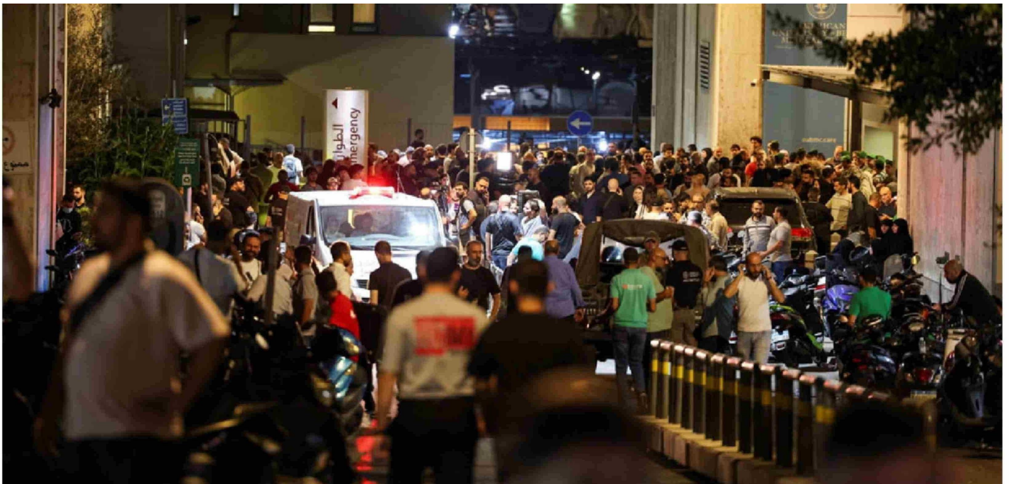
► La gente se reúne fuera del Centro Médico de la Universidad Americana de Beirut luego que más de 1.000 personas resultaran heridas, el 17 de septiembre de 2024.