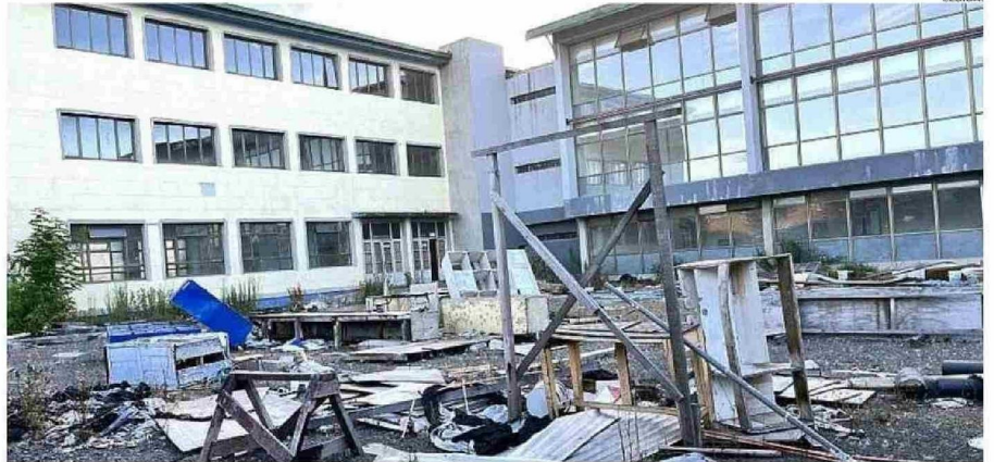
LAS OBRAS PARALIZADAS DEL LICEO CARMELA CARVAJAL DE PRAT HAN GENERADO LA MOLESTIA DE TODA LA COMUNIDAD OSORNINA Y HAN AFECTADO A MILES DE ALUMNOS QUE DESDE 2020 A LA FECHA NO CUENTAN CON UN ESTABLECIMIENTO PROPIO. NO HAY FECHA CLARA PARA EL REINICIO DE OBRAS.