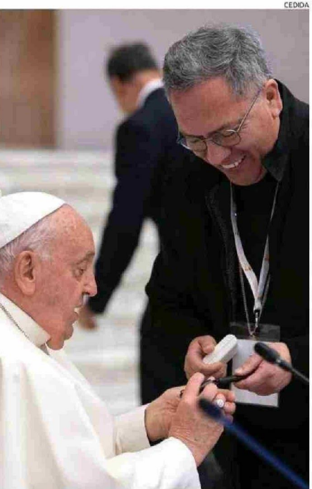
EN OCTUBRE, EL OBISPO DE OSORNO, CARLOS GODOY, SE REUNIÓ CON EL PAPA FRANCISCO EN EL MARCO DEL SÍNODO REALIZADO EN ROMA.