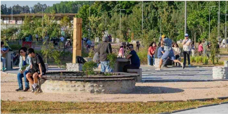
EN DICIEMBRE SE ABRIÓ AL USO PÚBLICO EL PARQUE HOTT, EN OVEJERÍA, DESPUÉS DE MÁS DE 40 AÑOS DE LUCHA VECINAL PARA CONSTRUIRLO.