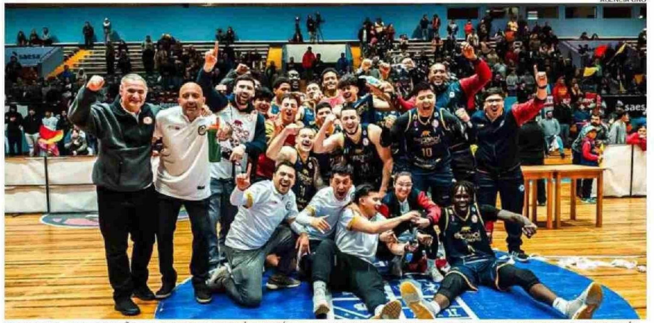
EN OCTUBRE, EL CLUB ESPAÑOL DE OSORNO SE CORONÓ CAMPEÓN DE LA SUPERCOPA 2024 AL IMPONERSE ANTE LA UNIVERSIDAD DE CONCEPCIÓN.