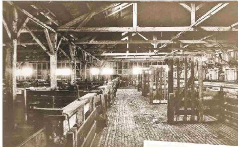
Imagen desde el interior de uno de los galpones de Oazy Harbour, donde el escritor José Donoso trabajó como peón en la temporada 1945-1946.