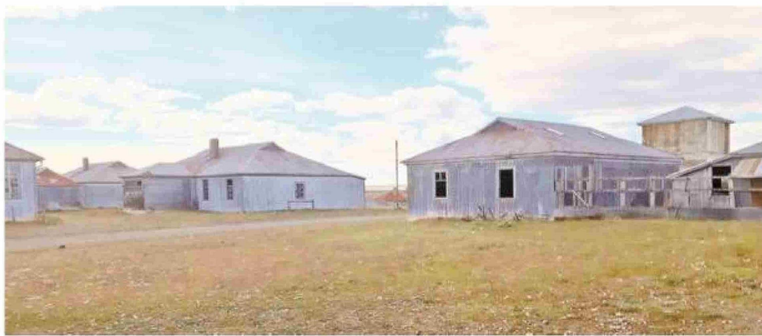
Así lucía en 2021 la exestancia Oazy Harbour, en la comuna de San Gregorio.

Su regreso a nuestro país coincidió con la edición de algunos títulos de distinta factura. A "Poemas de un novelista" siguió la publicación que la editorial Seix Barral hizo en 1981 de otra de sus novelas más importantes: "El jardín de al lado". Después se conoció "Cuatro para Delfina" libro conformado por cuatro novelas, "Sueños de mala muerte",