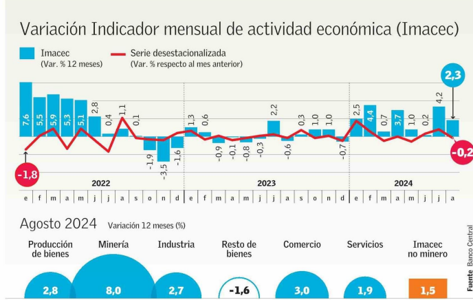
Agosto 2024 Variación 12 meses (%)

Hasta ahora, recapitula el coordinador macroeconómico de Clapes UC, Hermann González, el crecimiento acumulado en 2024 es de 2,3%, con lo cual la meta del Gobierno es "alta, pero no inalcanzable". Anticipa que