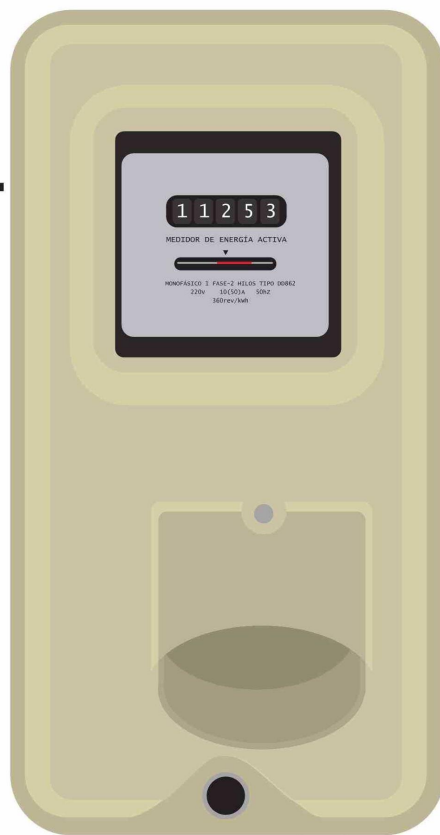
ILUSTRACIÓN: ANDRÉS OREÑA P.