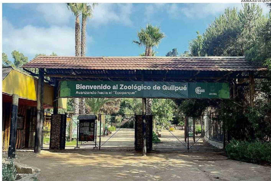
EL RECINTO ESTÁ UBICADO EN EL FUNDO EL CARMEN.

La autoridad enfatizó que los nuevos lineamientos de trabajo priorizan la educación ambiental, la sostenibilidad, el bienestar animal