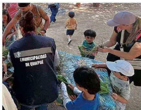
LOS TALLERES CONSISTEN EN LA PREPARACIÓN DE ALIMENTOS.