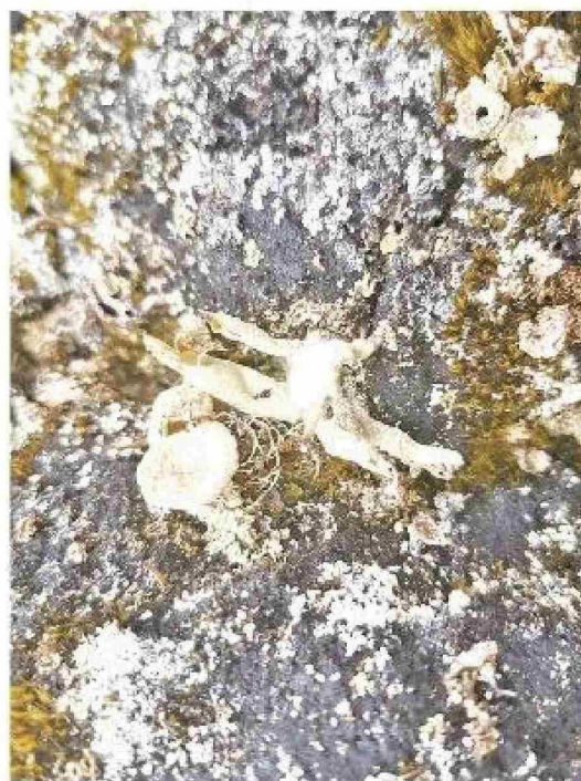
Liquen Cladonia cariosa colectado en la isla Ardley, fuente del compuesto ácido fumarprotocetrárico.

» Las enfermedades neurodegenerativas representan una carga significativa para la salud pública a nivel global, y se espera que su incidencia se triplique al 2040 debido al envejecimiento de la población