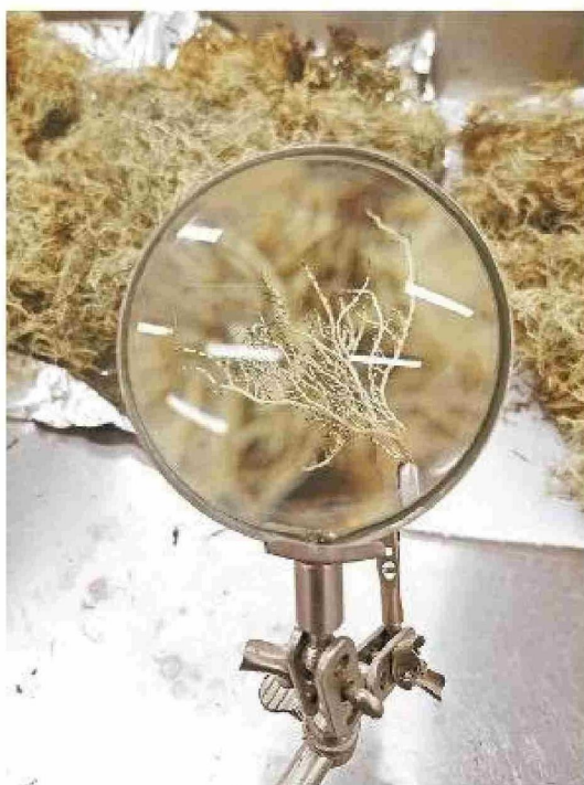
Liquen observado desde la lupa.

Cornejo señala que los medicamentos actuales solo tratan los síntomas y no pueden revertir la enfermedad. "Desde el punto de vista terapéutico, el tratamiento para ambas enfermedades está orientado a la sintomatología y