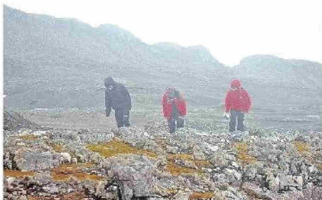
Investigadores en terreno.