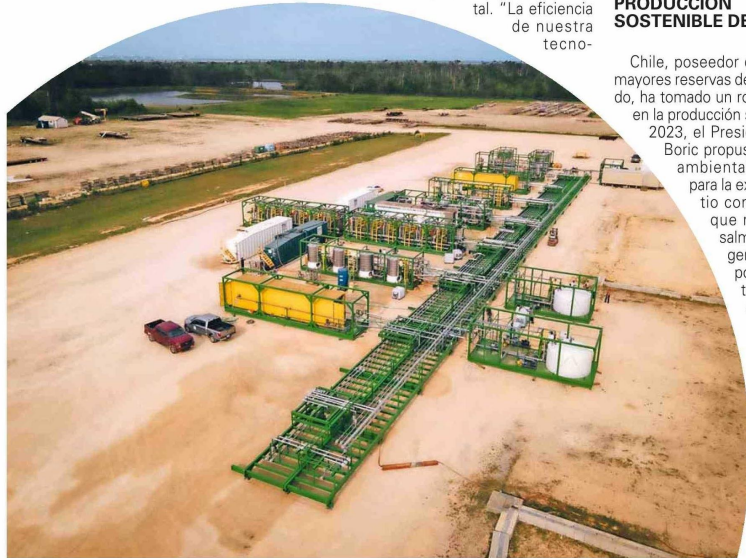
Planta de Extracción Directa de Litio (DLE) de Sorcia.

nerals, sostiene: "La tecnología DLE desarrollada por IBAT permite que Chile y otros países con recursos de salmuera puedan producir litio sin poner en riesgo los ecosistemas. Nuestro objetivo es desarrollar un modelo de producción que proteja el medio ambiente mientras contribuye a la transición energética".