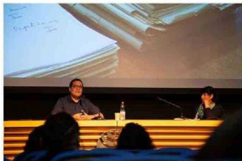
EL TEXTO FUE PRESENTADO EN EL CAMPUS SAN JUAN PABLO II DE LA UNIVERSIDAD CATÓLICA DE TEMUCO.