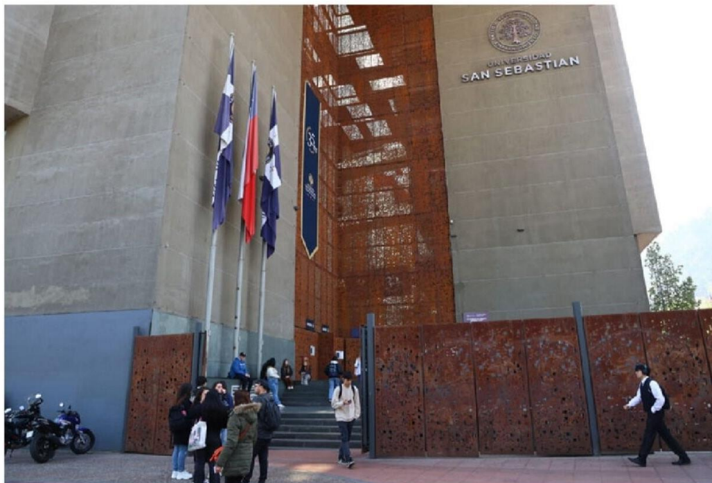
► El caso de la exministra Marcela Cubillos en la USS provocó fuertes cuestionamientos dentro de la casa de estudios y fuera de ella.

do', ¿quién lo define? Lo que en Chile está claro es que las universidades tenemos que cumplir obligaciones, el deber de informar, tenemos que cumplir nuestras funciones, que es una función social, generamos bienes públicos, por lo tanto estamos obligados a dar cuenta de nuestras actividades, pero no nos parece que deba haber una inhibición de la posibilidad de la universidad de ser autónoma respecto a la contratación.