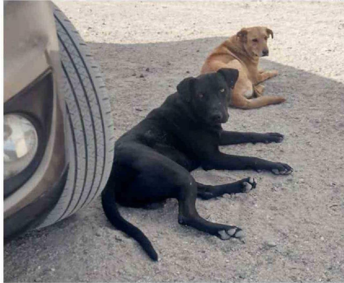
“NEGRO” Y “RUBIA”, JUNTO A “LUNA”, SIGUEN SIENDO VISITADOS POR VOLUNTARIOS ANIMALISTAS.

De esa manera, el vecino se esforzaba en evitar el maltrato o indiferencia que sufrían en otros lados. Tanto llegaba a amarlos, que cuando alguno moría, los lloraba y sufría por ello.