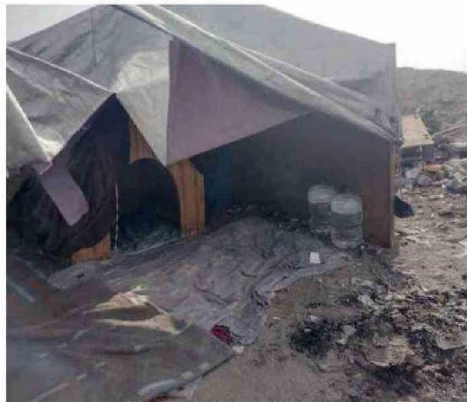
LA IDEA ES REDUCIR EL RUCO A UN REFUGIO PARA SUS PERRITOS.