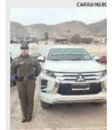
HUBO UN DETENIDO.