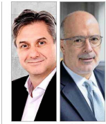
Occupan cargos en el Ministerio de Economía trasandino y el FML.

DEFENSAS ALISTAN APELACIONES ANTE LA CORTE PARA IMPUGNAR LA DECISIÓN DE LA JUEZA | C 1