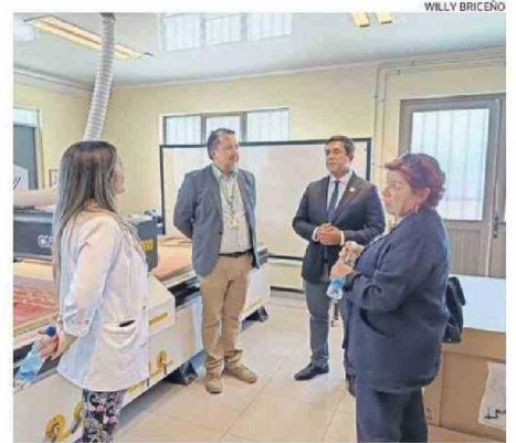
POSITIVO BALANCE DE PLAN DE TUTORÍAS EN COLEGIOS DE LA PROVINCIA.