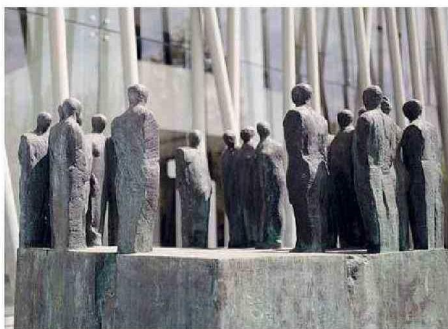
"ENCUENTRO", DE MARIO IRARRÁZABAL.

Es allí precisamente donde se erige el Museo Nacional de la Escultura, una institución única en Chile que se articula en tres espacios: el Parque de las Esculturas, con obras de gran formato que se levantan por todo el campus talquino, de libre acceso para el público; la Galería