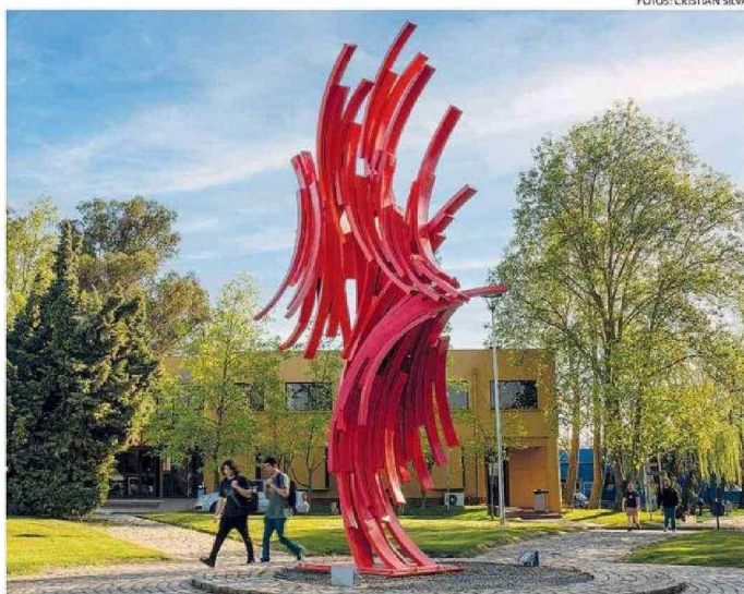
"TRUENO", DE SERGIO CASTILLO, FUE LA PRIMERA ESCULTURA DEL MUSEO AL AIRE LIBRE.

En Valparaíso estamos habituados a ver cómo los monumentos y esculturas en el espacio público son vandalizados. Basta darse una vuelta por el bandejón de avenida Brasil para darse cuenta de cómo cada una de esas piezas han sido grafiteadas y ensuciadas hasta volverse irreconocibles. En abril pasado, vimos cómo el Monumento a la Solidaridad, del artista Mario Irarrázabal, en el bandejón central de la avenida Argentina, debió ser desmantelado luego de sufrir un incendio en 2020 que lo dejó irrecuperable. Los ejemplos abundan, incluso en obras de arte que están ubicadas al interior de establecimientos educacionales de la zona, por lo que resulta aún más llamativo que las grandes esculturas ubicadas en este campus estén en impecable estado, bien conservadas y sin muestras de van-