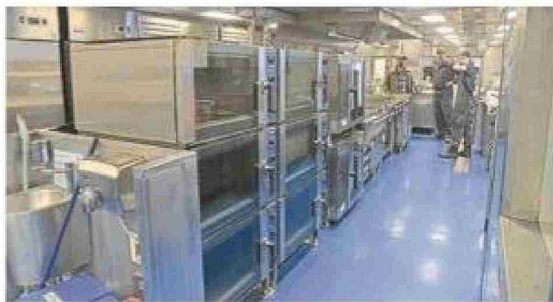
El equipo de cocina prepara comida para 130 personas en tiempos de navegación.