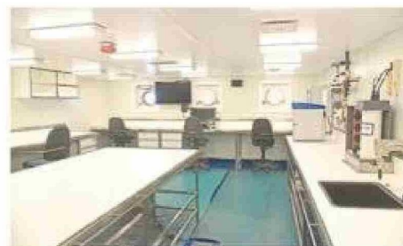
Los laboratorios cuentan con espacio para que los científicos dispongan de sus equipos.

Regresó de su primera comisión en el continente blanco