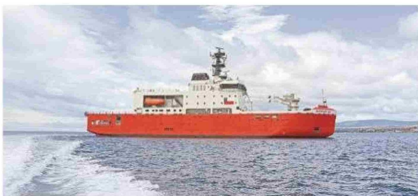
El buque tiene 111 metros de eslora (largo) y una manga (ancho) de 21 metros, además de un calado de 7,2.

El Almirante Viel es una embarcación tipo polar, especializada en romper hielo medio. Forma parte del "trinomio antártico" junto al patrullero oceánico Marinero Fuentealba y el remolcador de alta mar Lientur. Viene a reemplazar al antiguo rompehielos, del mismo nombre, construido en 1969 en Canadá y que estuvo en