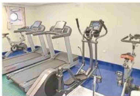
Lavandería, peluquería y gimnasio son algunos de los espacios que mejoran la habitabilidad del buque.