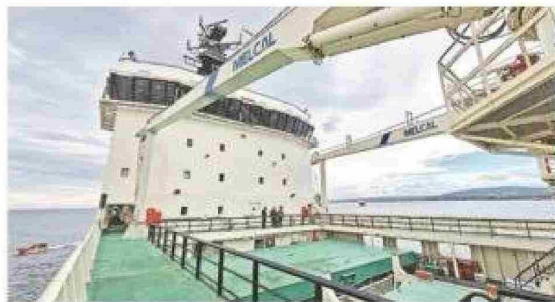
Las grúas tienen una capacidad para soportar 25 toneladas cada una.