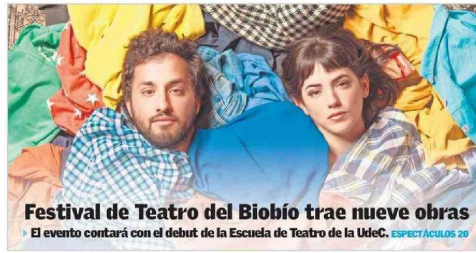
Festival de Teatro del Biobío trae nueve obras El evento contará con el debut de la Escuela de Teatro de la UdeC. ESPECTACULOS 20