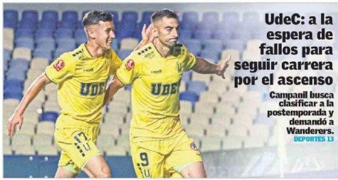
UdeC: a la espera de fallos para seguir carrera por el ascenso Campanil busca clasificar a la postemporada y demandó a Wanderers. DEPORTES 13