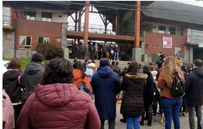
LA EDUCACIÓN PÚBLICA EN SAN PABLO ESTÁ EN CRISIS DESDE EL AÑO 2021, SIN QUE EXISTAN SOLUCIONES.

es el déficit mensual que genera el Daem de San Pablo debido a que el gasto que tienen supera los ingresos que reciben como sostenedores de la educación pública.