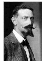
Emilio Jéquier, responsable del diseño de la Estación Pirque.

muy pocos los chilenos que vivieron esa época y por eso la instalación nos permitirá tener una idea del trabajo de Emile Jéquier en un espacio emblemático de la ciudad”, dice la alcaldesa de Providencia, Evelyn Matthei.