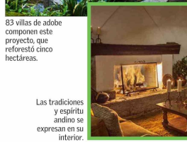
83 villas de adobe componen este proyecto, que reforestó cinco hectáreas.

Con casi medio siglo de experiencia en turismo sostenible, Inkaterra ha sido reconocida como la primera marca hotelera "Climáticamente positiva" del mundo.