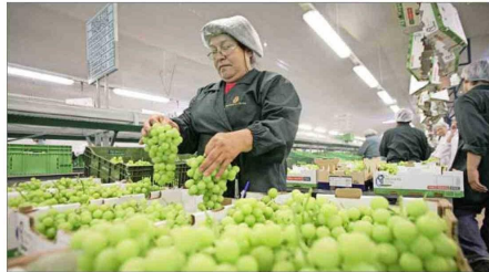
En abril, según ProChile, los envíos de fruta impulsaron al sector agropecuario. Destacó el envío de uvas por US$ 340 millones, igual a un alza de 39,5%.

Esta evolución da cuenta del mayor deterioro relativo que ha tenido el comercio exterior de la minería, que promedió un crecimiento anual de 21,6% entre 2004 y 2013, que decayó a 3,1% en la última década. El fuerte crecimiento en los envíos de carbonato de litio, que pasaron des-