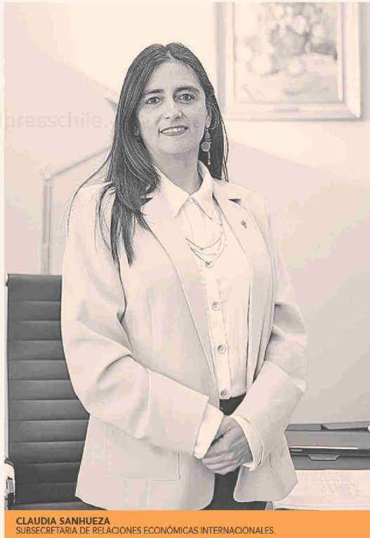
CLAUDIA SANHUEZA SUBSECRETARIA DE RELACIONES ECONÓMICAS INTERNACIONALES.

Presidente de ChileCarne señala que los envíos de carne de cerdo al mercado japonés aumentaron 27% en volumen y 34% en valor en 2023.