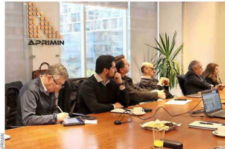
Reunión Comité de Inversiones, oficina Aprimin.

La evolución de los proveedores mineros ha sido destacable, hoy por hoy no solo entregan equipos y servicios, sino que se han convertido en colaboradores clave en la optimización de procesos, reducción de costos operacionales y minimización del impacto